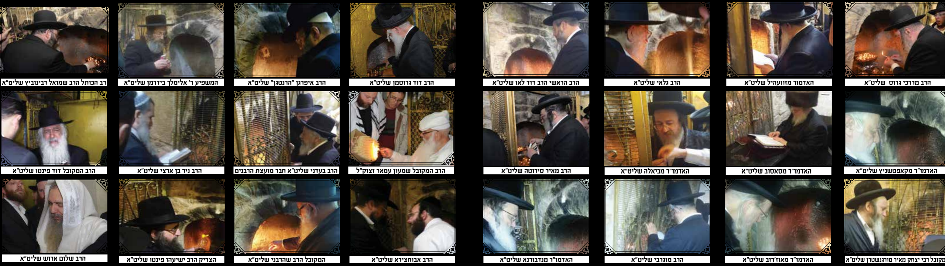
רב הכותל הרב שמואל רבינוביץ שליט"א